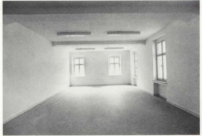
ur 9, großer Raum/large room, Mönchengladbach 1992, 1000 x 576 x 325 cm, S 1,8-33 cm

Der Held dieser anderen Welt, Gregor Schneider, betreibt einen völlig unangemessenen Aufwand, um ein und denselben Raum Stein für Stein – es soll sich um ein Gewicht von 3 Tonnen han-