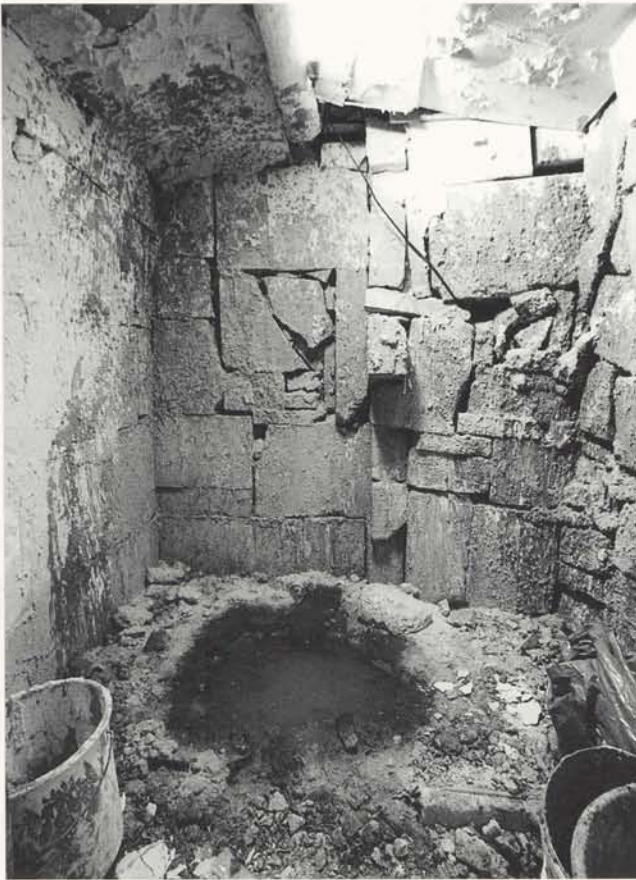
ur 14, Das letzte Loch/Dump, Rheydt 1995, 230 x 208 x 258 cm, S 10-30 cm