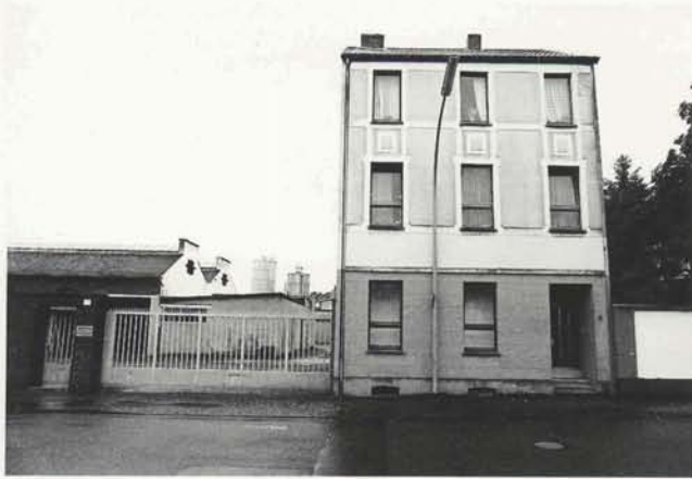
Totes Haus ur/Dead house ur, Rheydt 1985-99