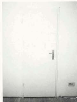
Kellereingang/Cellar entrance, Mailand/Milano 1999

So not a play after all, at least not one by Beckett ... or is it? The house really does exist. Tiled three-story façade, a door, a narrow wooden stairway leading to a room in which a table set in white offers up coffee and cake. Here I am met by a short man with lively eyes whom I already know from the plays. The atmosphere in the room is one of petit bourgeois Gemütlichkeit. Then the man pushes a wall aside. I enter an in-between space which allows me to see that the coffee room rotates, like a stage, on its own axis, and that the window is an illusion. It's mounted, like a mirror image, in front of the window to the outside. Another wall is raised. I squeeze myself, half bent over, through a hallway and enter, through the inside of a wardrobe,