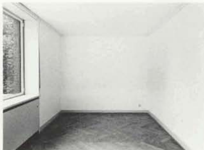
ur 61, ausgetauschtes Wandstück/traded wall, Krefeld 1994, 65 x 55 cm, S 11 cm