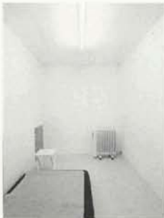
ur 12, total isoliertes Gästezimmer/completely isolated guestroom, Rheydt 1995, 275 x 402 x 304,5 cm, S 12-100 cm

Throughout all the works of Samuel Beckett—whether novels, stories, or plays—the insoluble contradiction is something like a common thread. This contradiction goes back to Augustine, as Beckett himself says: "There's a wonderful sentence in Augustine ... 'Despair not, for one of your thieves is redeemed. Rejoice not, for one of your thieves is damned.'" And it was with these sentences as the backdrop that Beckett once explained one of the contradictions in "Waiting for Godot", namely Estragon's constant troubles with his feet and his shoes: "One of Estragon's feet is blessed and the other damned. The boot doesn't fit the foot that's damned; it fits the one that isn't. Like the two thieves on the cross."