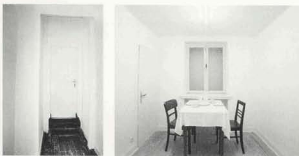
ur 10, Eingang/Entrance; ur 10, drehendes Kaffeezimmer/revolving coffeeroom, 246 x 234 cm, Rheydt 1993, Wandstärke/thickness of the wall S 1,8-35 cm

Someone told me about a play. It was supposedly called "What a Dump". In the play the curtain went up and, in the weak onstage light, "various pieces of unrecognizable junk" became visible; only as the light grew stronger did one become aware of the room itself, constructed from irregularly-sized, damp blocks. The stones were crumbling under their own weight—some had already tumbled out of the wall and lay in pieces on the floor. In the middle of the rubble stood a depression filled with stagnant water—a stinking puddle. All around there were old, filthy buckets. In the center of all this rubbish stood a man. His name was Gregor Schneider. Short, with blond hair and lively eyes, this man proceeded to dismantle the room, stone by stone, with quick movements. He laid the stones in rows on the floor, and then he