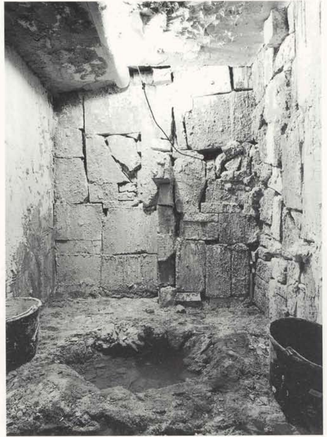
ur 14, Das letzte Loch/Dump, Mailand 1999, 230 x 208 x 258 cm, S 10-30 cm