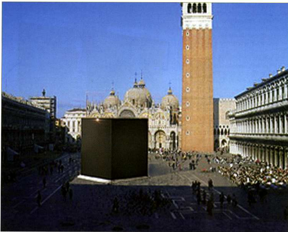
GREGOR SCHNEIDER, Cube Venice 2005