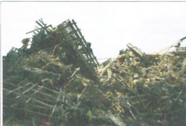
Schneider/Meister, Bild 1 von 2

Der Bildhauer Gregor Schneider und die evangelische Kirche mussten ihr Kunstprojekt stoppen.