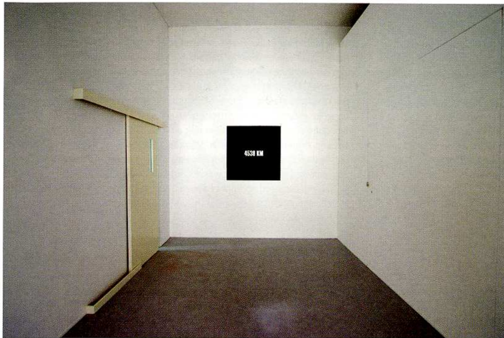
Gregor Schneider, '4538 KM', 2006, 02.04-21.05, MDD (Museum Dhondt-Dhaenens)

men altijd weer terug. Ik ga geregeld uit van alledaagse situaties, van ruimtes waarin zich voor mij mijn levenswerkelijkheid spiegelt en deze ruimte wordt dan verdubbeld. Dat is eigenlijk de werkwijze. In het huis heeft deze verdubbeling zich reeds zo ver verzelfstandigd dat er ook bewegende plafonds, draaiende kamers, niet waarneembare beweging zijn ingebouwd. Dus hoe langer ik me dat huis ophoud, des te onbekender wordt het voor mij. Met de techniek van het herhalen ontstaat een lege ruimte, een tussenruimte. Het heeft natuurlijk sterk met de ervaring van een ruimte te maken. Het werk staat eenvoudigweg in de traditie, weg van het beeld, weg van de sculptuur en ontstaat uit, zo probeer ik het voor mezelf te verklaren, de interesse voor dat wat wij niet meer kunnen kennen. Dat is, denk ik, de diepere drijfveer: de aantrekkingskracht van iets dat ik niet meer kennen kan. Dat kan je bouwen en dat is dan daar."